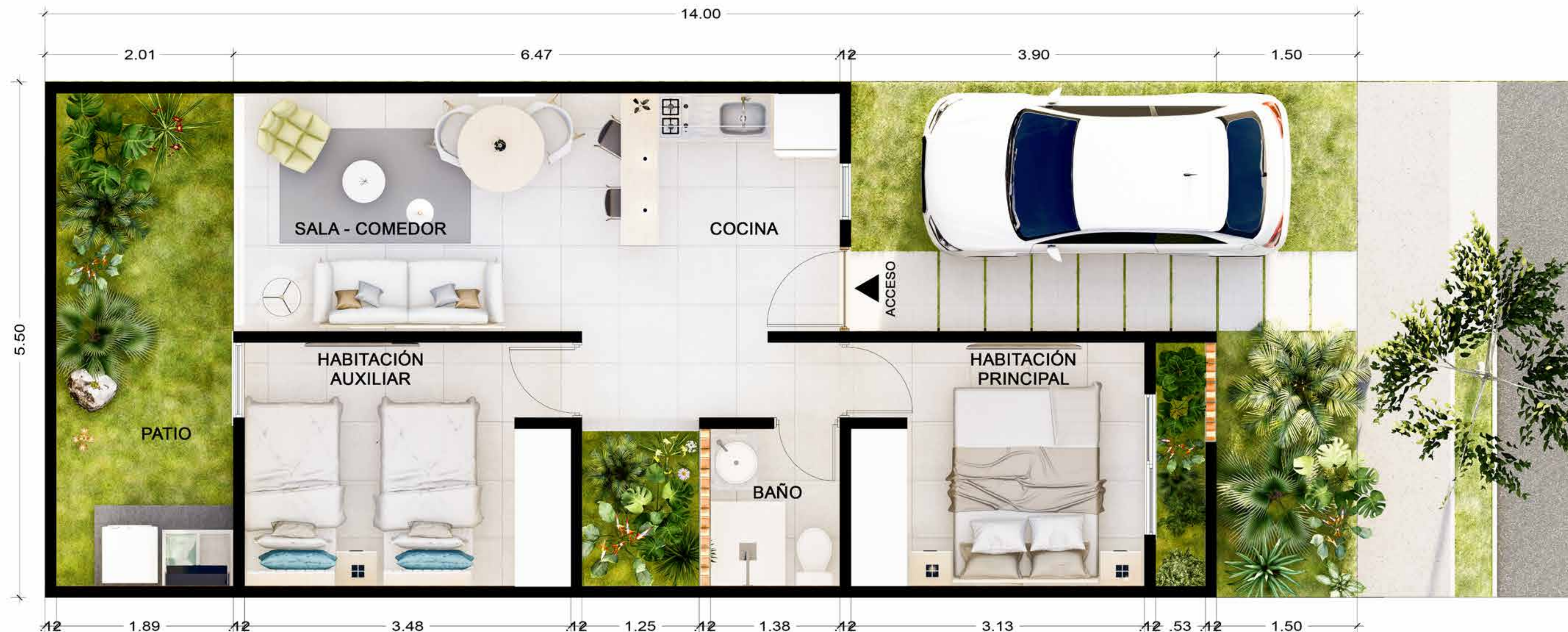
PLANTA TIPO MANZANA B Y F

Área del lote: 77,00 M2 Área construida: 45,00 M2