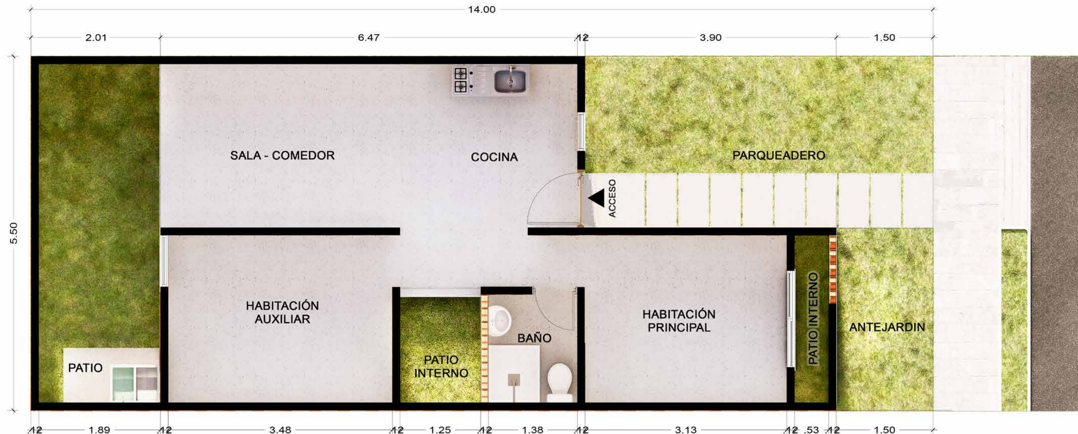
PLANTA CONSTRUIDA MANZANA B Y F

Área del lote: 77,00 M2 Área construida: 45,00 M2